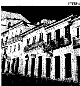
Brasile. Abitazioni colorate a Salvador de Bahia

■ www.houseloft.com , molte proposte internazionali nelle top location più note.