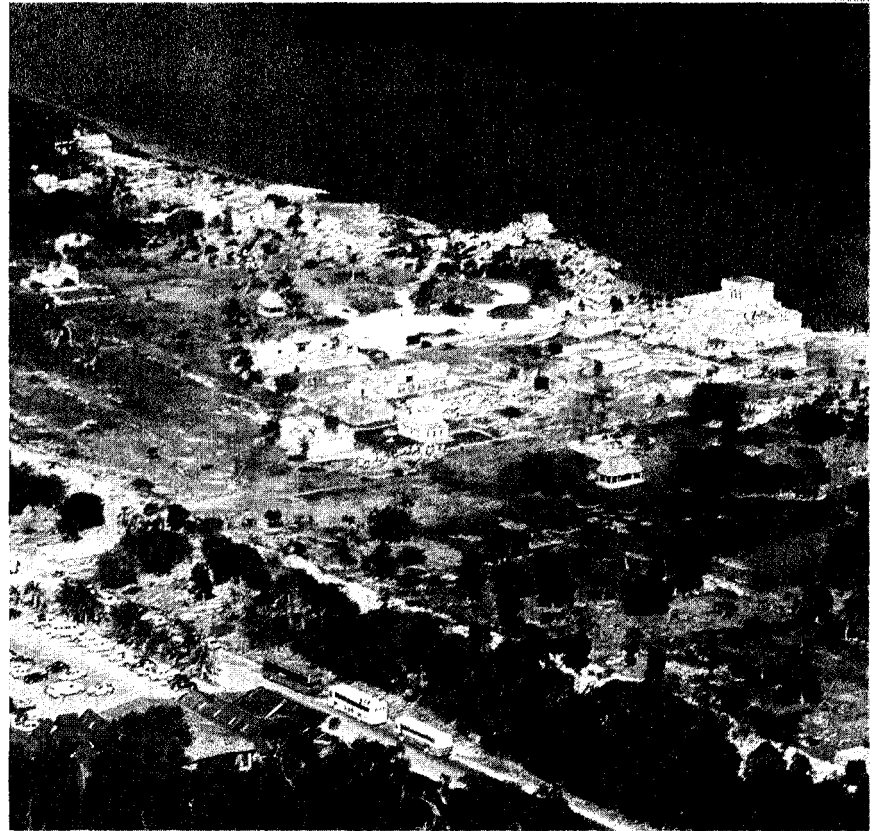
Dall'alto. Vista dell'area di Tulum: a circa 15 chilometri sorgerà il nuovo scalo intercontinentale