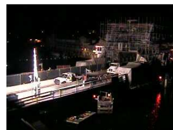
Wallingford, Connecticut, USA New | Screensaver