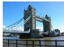
Scendono i prezzi degli immobili sulle sponde del Tamigi. I